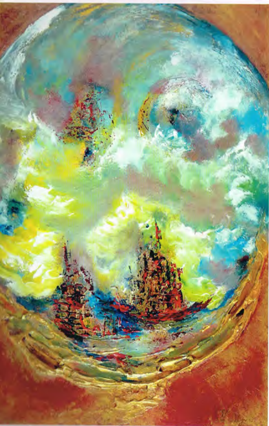
L'Éclaircissement de l'Orient, 36 x 24 in, 2013