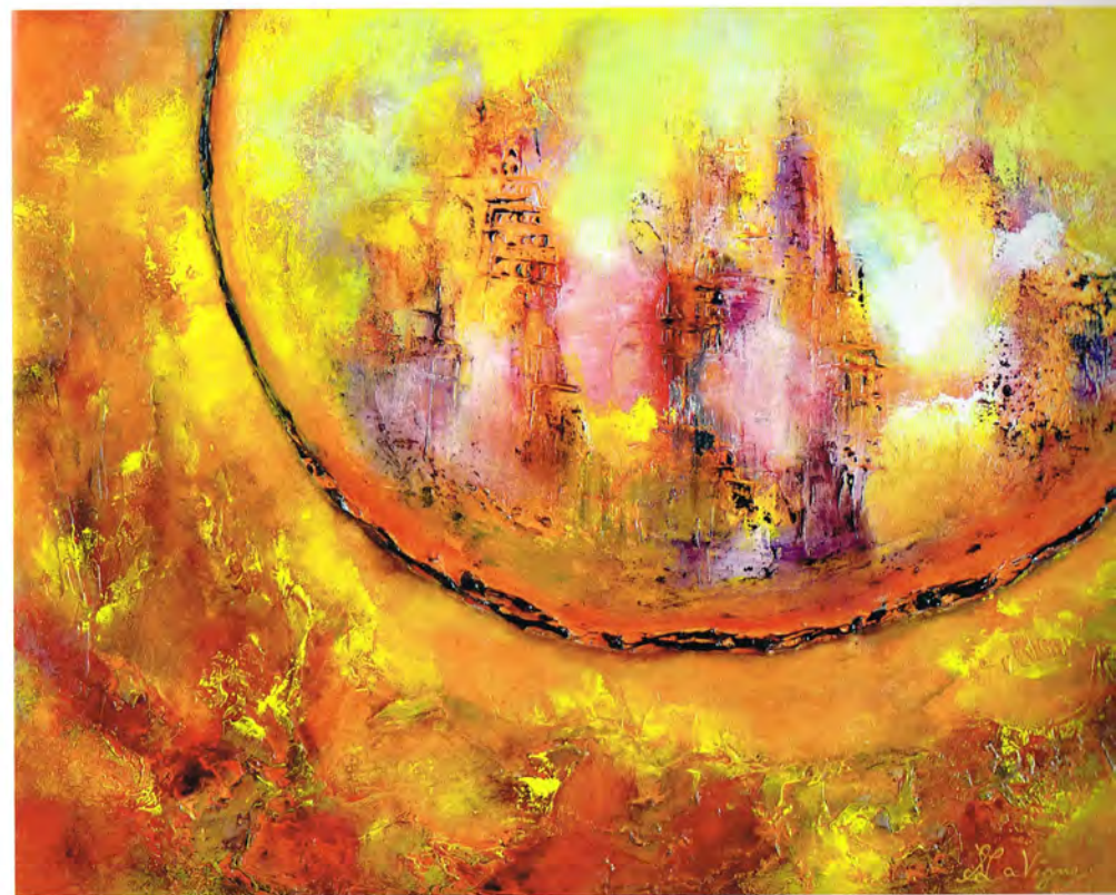
Linode, 22 x 28 in, 2013

The artist's undeniable mastery of her craft produces highly textured works where excess thickness is adroitly emphasized by the juxtaposition and superposition of colours. Her extremely personal technique warrants a certain amount of self-control. Suzanne Lavigne's paintings procure a soothing effect; the spectator soon relaxes as tensions due to stress are alleviated. There is presence of a Zen dimension in some of her works, which promotes calm, peace and meditation.