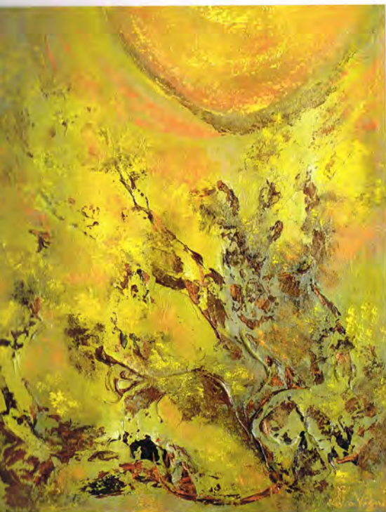
De génération en génération, 36 x 60 in, 2013

collective, solo and duo exhibitions. She also makes her mark participating in Canadian and international exhibitions and events such as in Spain, Belgium and Romania. Since 2007, her work has been awarded numerous prizes and distinctions. Thus she was the recipient of great distinction prizes and bronze and silver medals awarded by the Cercle des Artistes Peintres et Sculpteurs du Québec (CAPSQ) and an honorific great distinction award from the Collectif International d'Artistes ArtZoom (CIAAZ), in 2012, to underline her twenty years artistic career. Her works are also the object of a number of audiovisual and television productions. In 2013, she receives international recognition as a painter for her overseas exhibitions, which opens the door to all sorts of future possibilities. She is also one of the finalists to receive the annual bursary awarded by Fondation ForCGal .