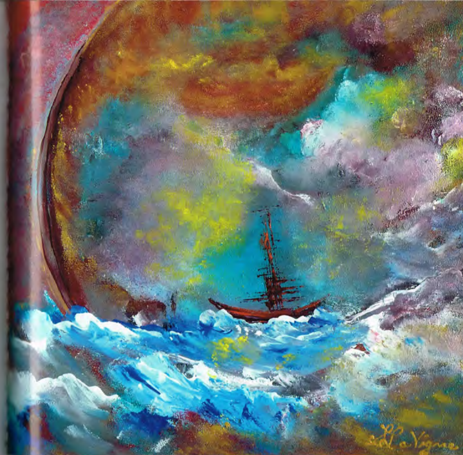
Flâneuse liberté, 18 x 18 po, 2013