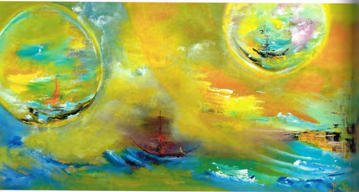
Entre ciel et mer, 24 x 40 po, 2013